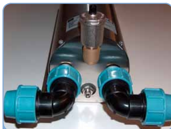
Autoudlufter øverst, luftskruer nederst Tilgange kan drejes i alle retninger