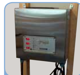
60x60x30cm – 42kg