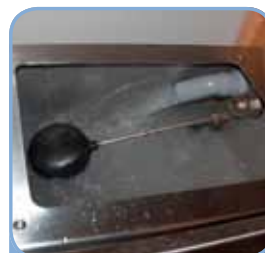
Tank i top

Returtemperatur lav, returtemperatur høj, overkogning, frostrisiko.