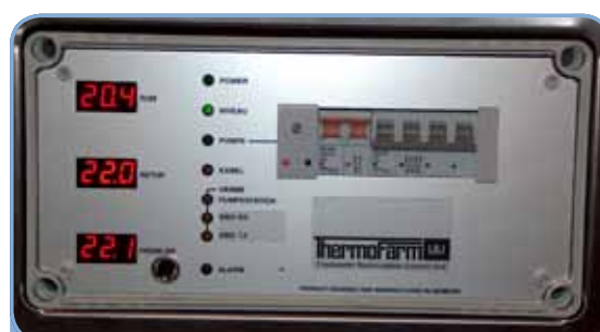
Styring med visning af temperaturer, status og alarmer