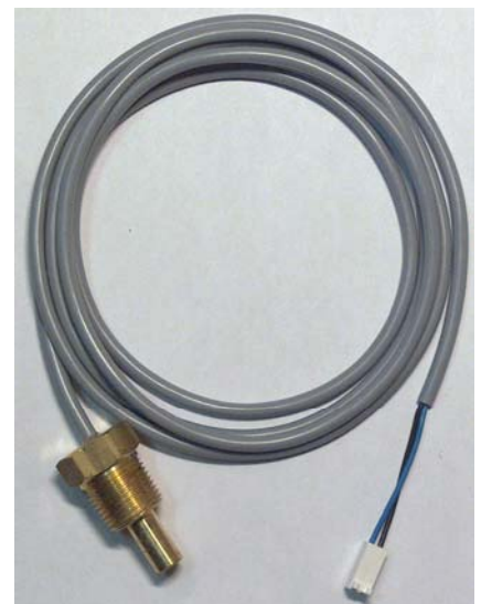
Føler m/1.5m kabel