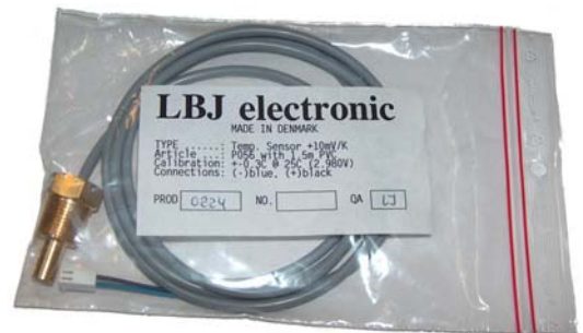
Kabeltype og forbindelser fremgår af posen

Anvend pakkegarn eller lign. Før føleren skrues i, drejes den nogle omgange modsat uret så kablet ikke snor, når føleren er monteret.